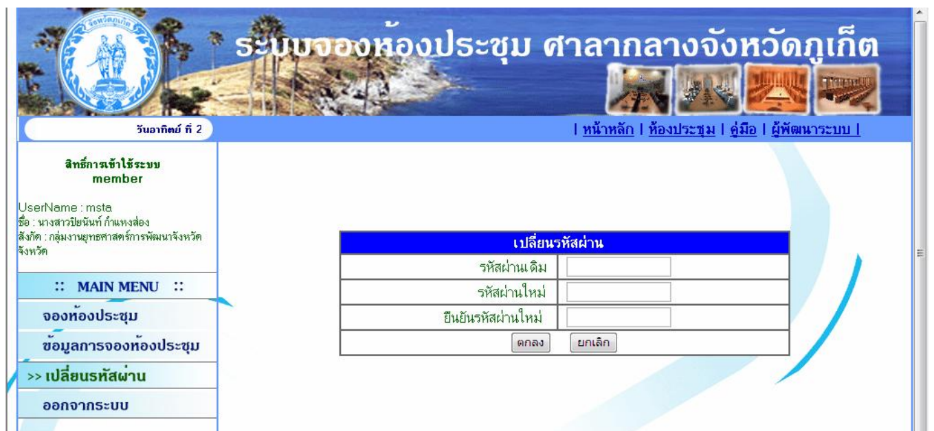
ดังภาพที่ 6